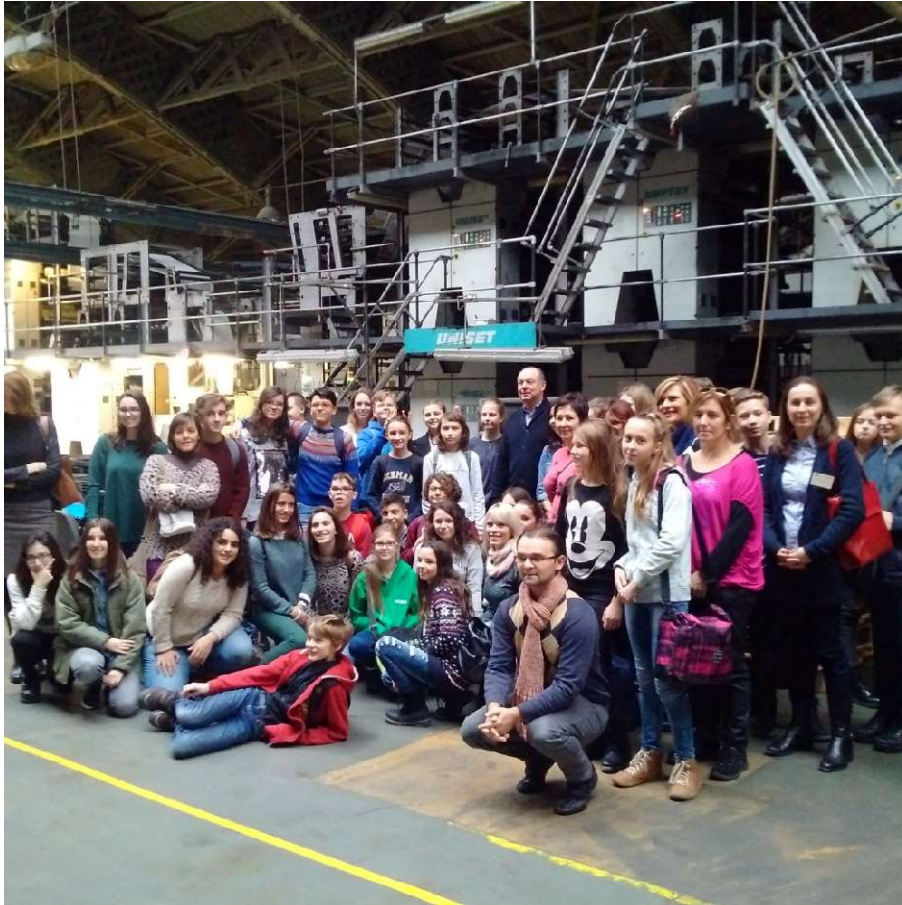
*Asistencia al Ballet “El Cascanueces” y entrevista en inglés con los bailarines principales