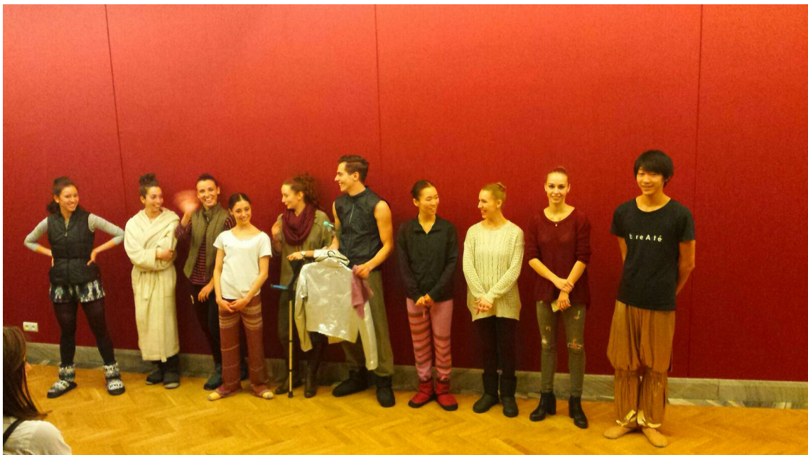
*Visita al Museo de Copérnico en Varsovia